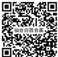
写真 アップロード手順